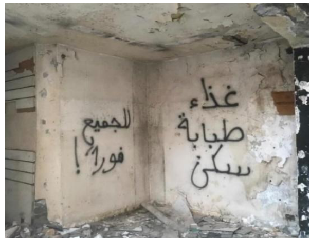
Food, health, and housing for everyone immediately, Sarhan, 2020

Durch die Kriminalisierung von Solidaritätsaktionen mit Menschen auf der Flucht trägt der Libanon auch dazu bei, dass der Raum für die Zivilgesellschaft immer mehr schwindet. Dadurch wird die Misshandlung von Menschen auf der Flucht nicht angefochten und die Stimmen der Zivilgesellschaft werden zum Schweigen gebracht.