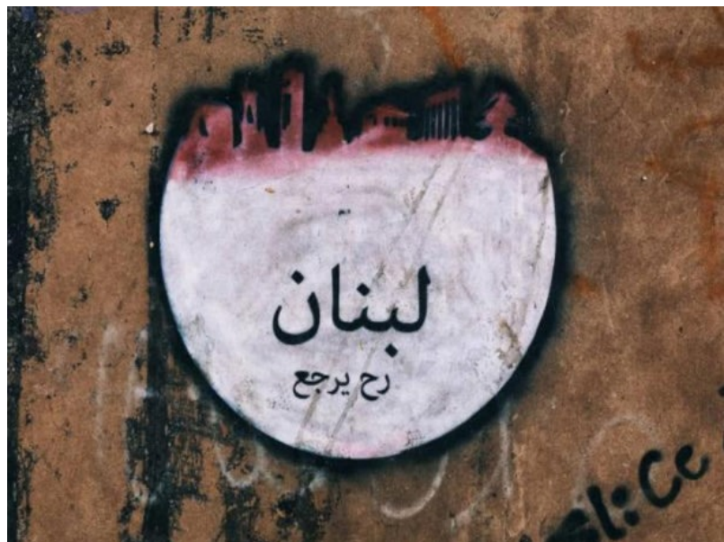
Lebanon will come back, Sarhan, 2020

Nota Bene: Es ist interessant, dass die Vereinigten Staaten von Amerika immer wieder unzählige Länder aufgesucht haben (z. B. Vietnam, Irak, Afghanistan, Jemen), um Unruhe zu stiften, zahlreiche Menschen zu töten und sie auszubeuten, ohne auch nur annähernd dieselbe Reaktion zu erhalten, da ihre Bürger*innen nach wie vor ungehindert reisen können, ohne auf die gleiche Weise kriminalisiert zu werden, wie die USA Menschen kriminalisieren. Ebenso bemerkenswert ist es, dass auch europäische Länder zahlreiche Länder (z. B. die meisten Länder des afrikanischen Kontinents) kolonisiert und ausgebeutet haben (z. B. durch den Handel mit versklavten Menschen oder den Raub von Ressourcen), ohne auch nur annähernd eine vergleichbare Reaktion zu erhalten, da sie auch weiterhin ungehindert reisen können, wie Mau et al. (2015) gezeigt haben.